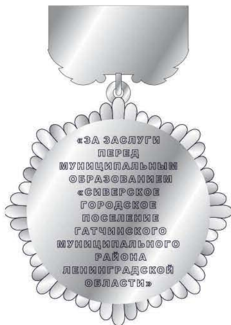
Лицевая сторона Знака.