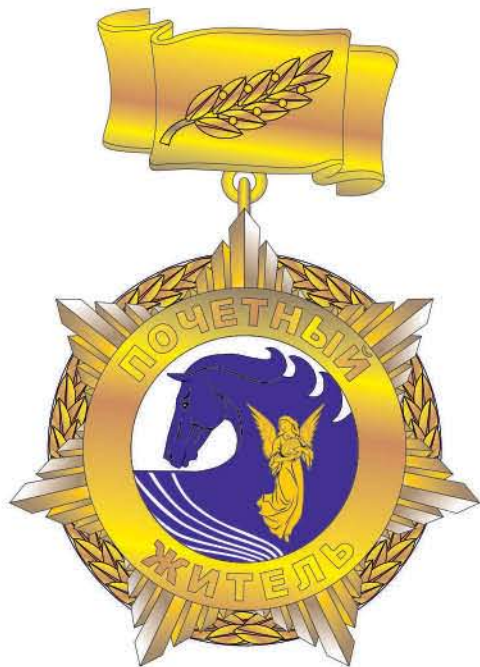
Лицевая сторона знака